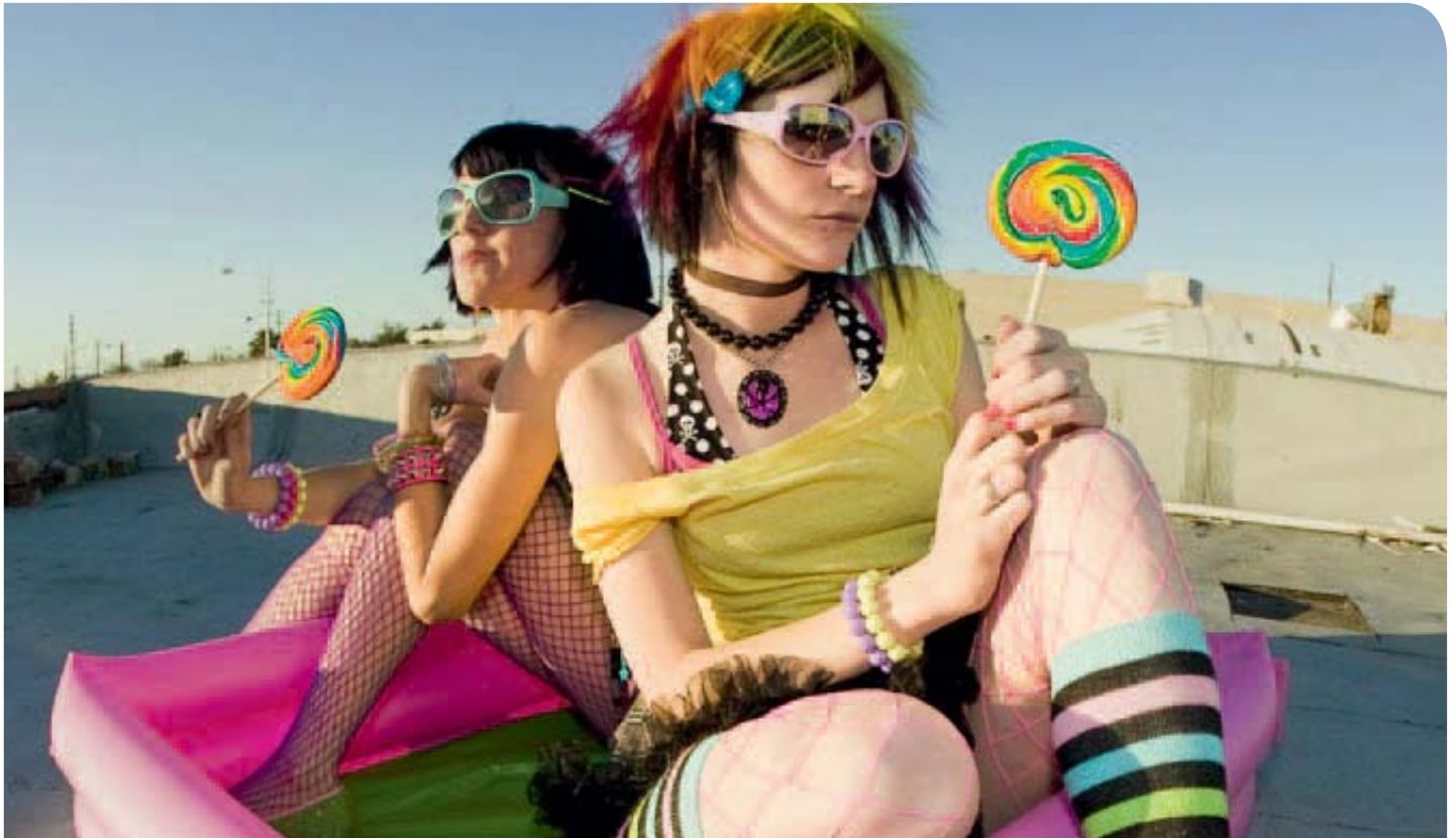
Ob diese Mädchen ihre Kleidung als ausgeflippt bezeichnen würden?

Beginn des 21. Jahrhunderts ändert sich viel Gewohntes immer schneller, die Norm von heute reicht der Norm von morgen die Hand. Entsprechend werden das Sehnen und der Wunsch nach Normen drängender, welche verbindlich und beständig sind – und wahrhaftig normal.