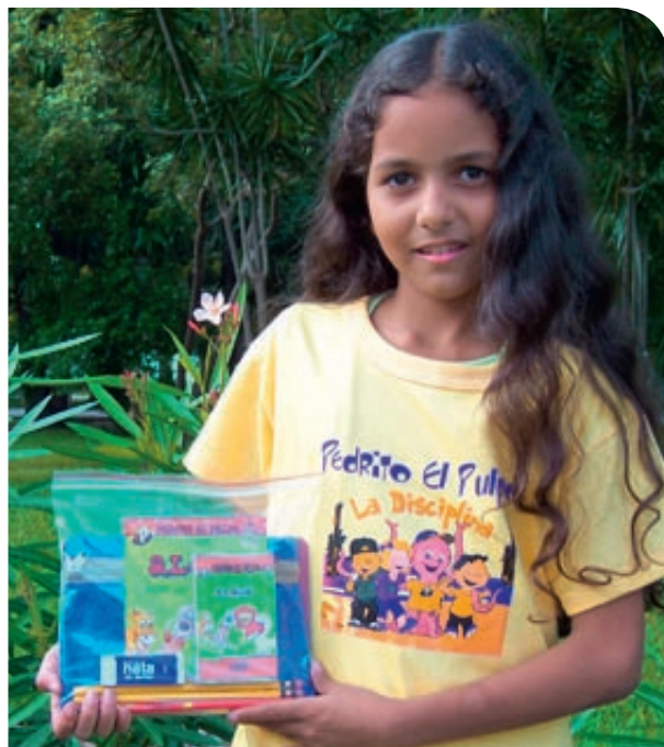
TWRs Aufklärung setzt schon bei den Kindern ein

sie sich lieben? Einige meiner Freunde haben mir erzählt, dass sie diese Worte noch nie von ihren Eltern, Onkeln oder Grosseltern gehört haben.» Tante Annabel gibt Pedrito nicht einfach fertige Antworten, sondern sucht diese zusammen mit ihm und seinen Freunden.