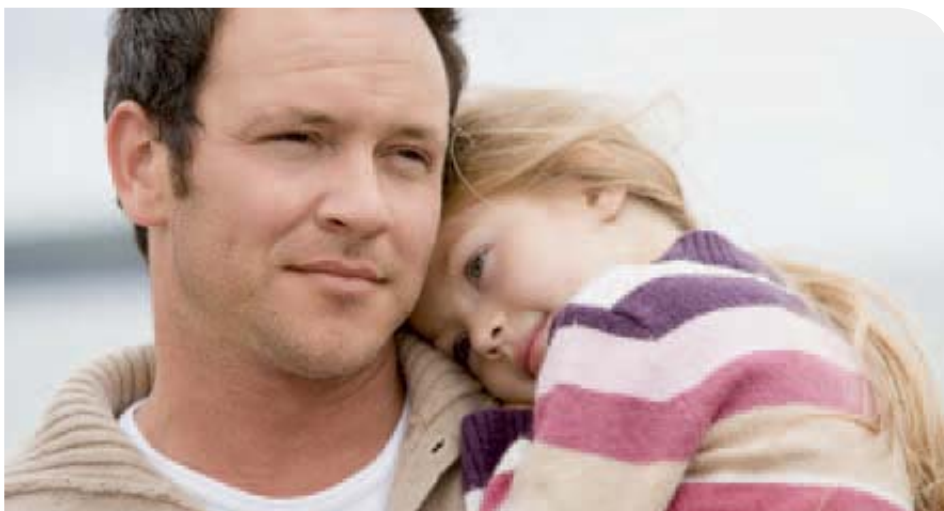
Gott freut sich über uns wie ein Vater über seine Kinder.