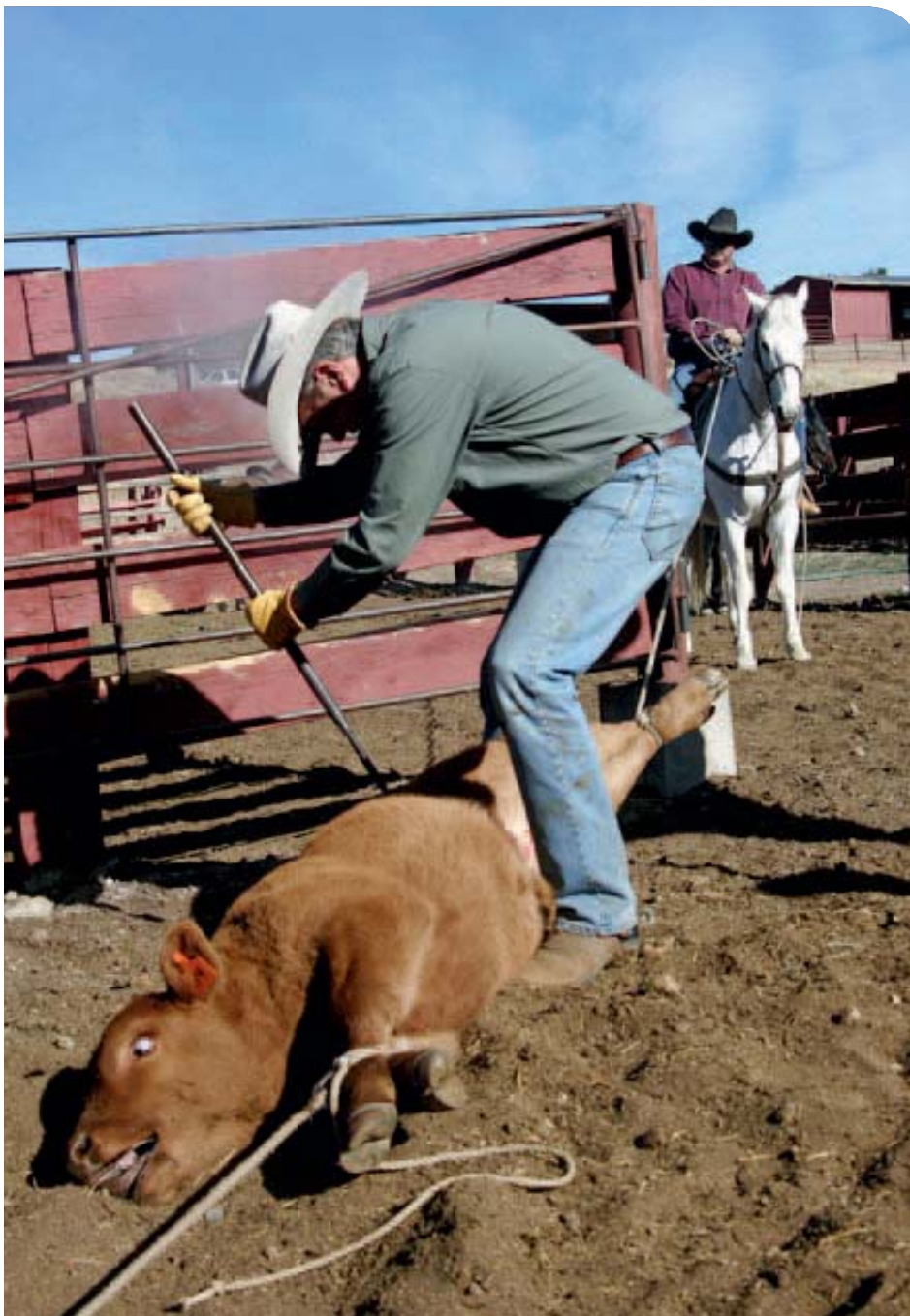
Das Signieren eines Rindes regelt den Besitzanspruch.

● «Segenswünsche» zum Geburtstag, zur Hochzeit, zur Geburt eines Kindes, «Segenswünsche» zu allen möglichen Gelegenheiten – was drücke ich eigentlich damit aus? Was meine ich konkret, wenn ich jemandem «Gottes Segen» wünsche? Was gibt mir der Pfarrer am Ende des Gottesdienstes mit auf den Weg, wenn er mit ausgebreiteten Armen vor der Gemeinde steht und ihr den «Segen» erteilt, der aus dem 4. Buch Mose stammt: «Der Herr segne dich und behüte dich; der Herr lasse sein Angesicht über dir leuchten und sei dir gnädig; der Herr hebe sein Angesicht über dich und gebe dir Frieden?»