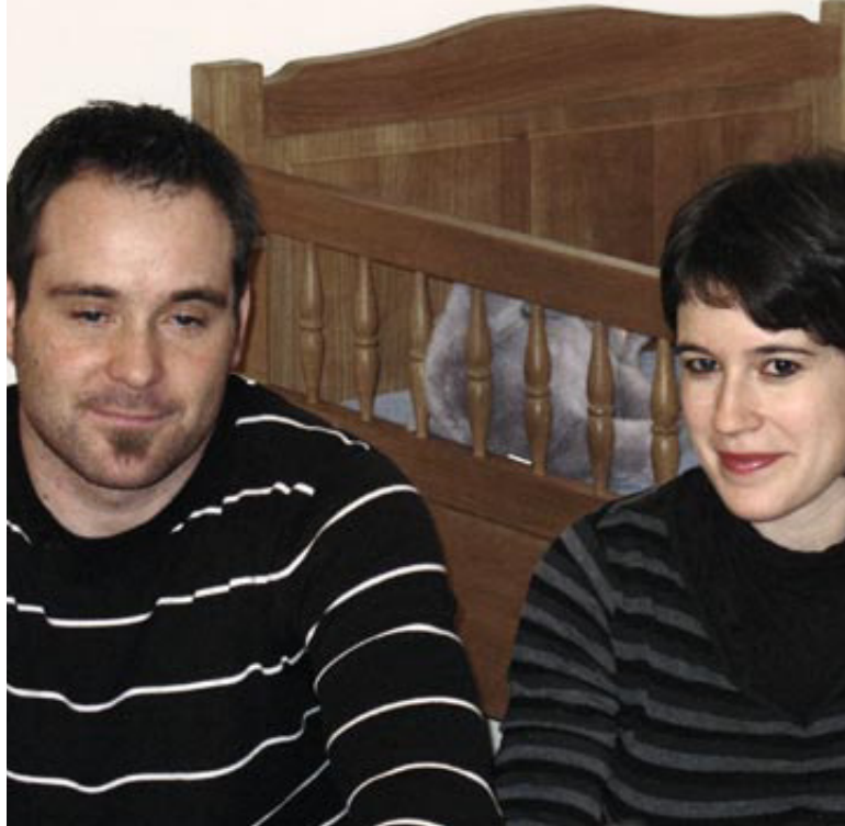
Die Wiege ist parat – doch wird sie benutzt werden?

Die siamesischen Zwillinge entwickeln sich während der Schwanger-