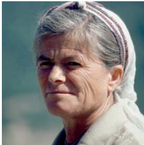
Projekt Hannah – in über 90 Ländern