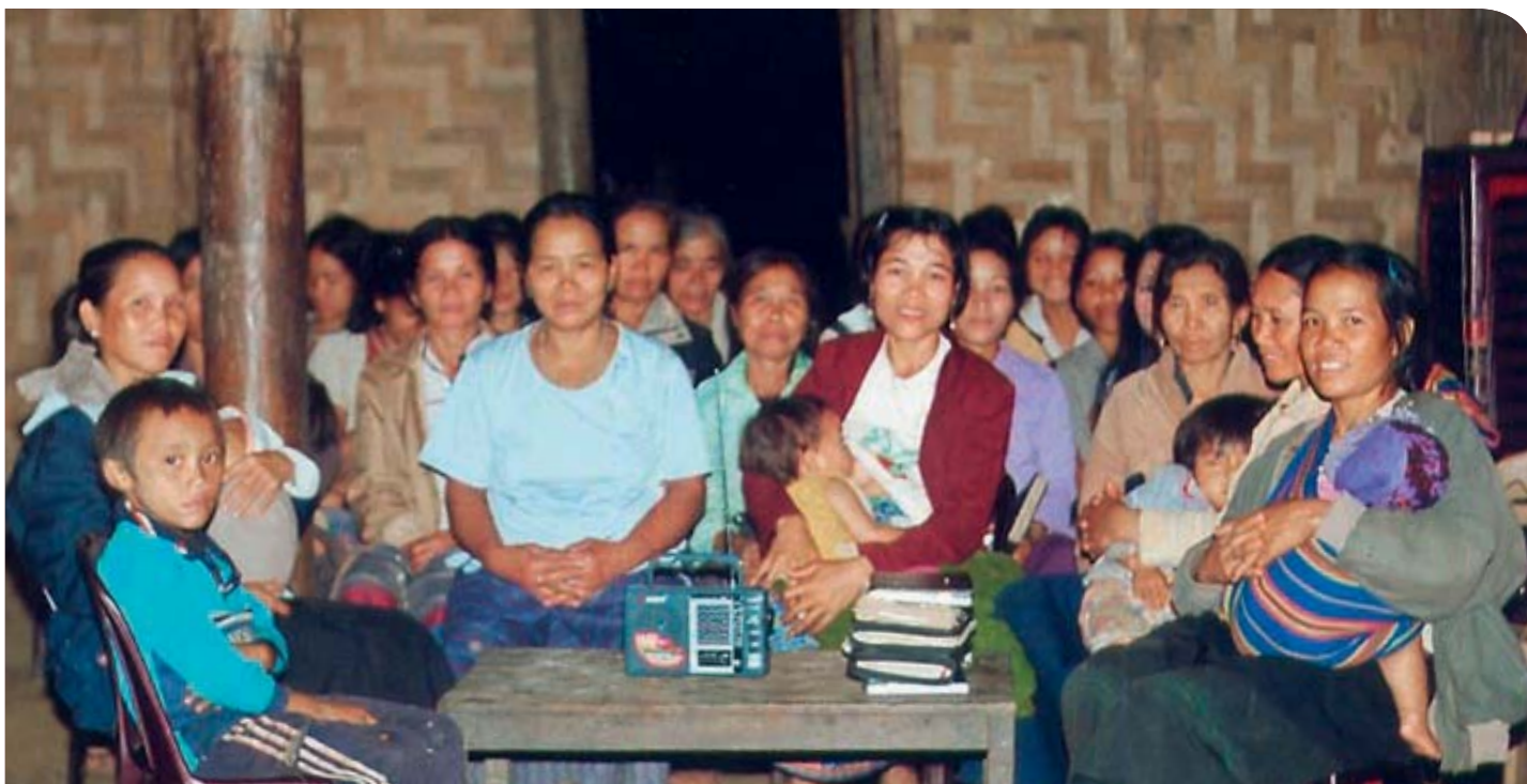
Ein kleines Radio – für viele Frauen das Tor zu neuen Lebensperspektiven